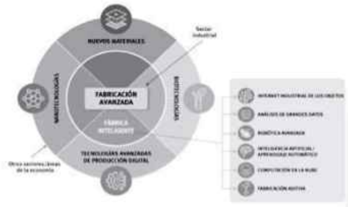
Figura 3.- Ámbitos tecnológicos de la Cuarta revolución industrial

El concepto se basa en el aumento de la convergencia entre diferentes ámbitos tecnológicos emergentes (tecnologías de producción digital, nanotecnologías, biotecnologías y nuevos materiales) y su complementariedad en la producción (Figura 3). La expresión que se utiliza habitualmente para referirse a la adopción de estas tecnologías en la producción manufacturera es fabricación avanzada. En el caso particular de las tecnologías de PDA, su aplicación en los procesos de manufactura da lugar a sistemas de producción de fabricación inteligente, también conocidos como fábrica inteligente o Industria 4.0. La fabricación inteligente implica la integración y el control de la producción desde sensores y equipos conectados en redes digitales, así como la fusión del mundo real y el virtual en los llamados sistemas ciber físicos (CPS), con el apoyo de la inteligencia artificial. Se espera que el paso a la producción de fabricación inteligente deje una impronta duradera en el panorama industrial.(ONU DI, 2020)